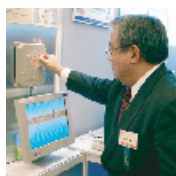
●名刺レスシステム ブース来場者の顧客情報管理