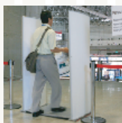
●入場可否管理システム 来場者の入場可/不可の管理

来場者が電子タグを持つことで、様々なサービスの提供が可能となり、より具体的なマーケティングデータを収集できます