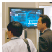
●スケジュール管理システム 来場者への情報提供・導線の管理