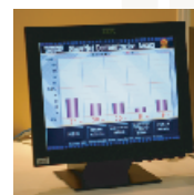
●投票システム 来場者参加型の投票システム